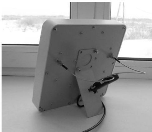
Рисунок 1. Пример установки антенны.

Типичным местом установки может послужить, стол у окна, оконный подоконник, подоконник лоджии. На рисунке 1 изображен пример установки антенны на оконном подоконнике