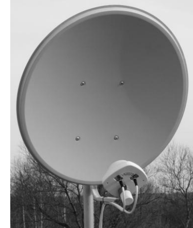
Рисунок 3. Установленный на «тарелку» облучатель с подключенными к нему соединительными кабелями.

3. Подключите нижний разъем (5) кабеля снижения (6) к разъему (3) антенного адаптера (4) (рис.2). Разъем (7) антенного адаптера вставьте в антенное гнездо (8) модема (1). Подключите модем (1) к компьютеру через USB-удлинитель (2). Аналогично подключите второй кабель снижения к модему через второй адаптер. Установите и запустите программу, поставляемую с модемом на вашем ПК. В настройках сети установите желаемый стандарт связи по умолчанию, например, "Только 4G/3G" или "Only LTE/3G".